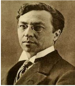
Wassily Kandinsky 1866-1944

Wassily Kandinsky wurde am 4. Dezember 1866 in Moskau geboren. Sein Vater war ein Teehändler aus Ostsibirien, seine Mutter eine Russin. Seine Eltern trennten sich, als Kandinsky noch ein Kind war. Er wurde hauptsächlich von seiner Tante erzogen und studierte später an der Universität Moskau Rechtswissenschaften. 1892 schloss er sein Studium erfolgreich ab und nahm eine Stelle als Dozent an der Moskauer Universität an. Während seiner vielen Auslandsaufenthalte entdeckte er seine Leidenschaft für die Malerei. In einem großen Kunstmuseum in Petersburg entdeckte er Bilder von Rembrandt und begann sich für die Malerei zu interessieren. 1896 entschied er sich, ganz der Malerei widmen und gab seinen Beruf auf. Viele Auslandsreisen und Ausstellungen folgten. Er lebte sogar sechs Jahre lang in München.